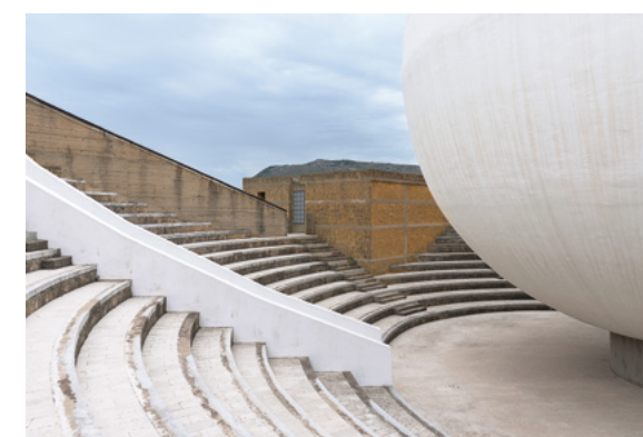
Work: Marta Ferrero

Il diplomato in Fotografia e audiovisivo potrà dedicarsi all'attività artistica, così come alle molte professioni creative legate al mondo della fotografia: potrà dedicarsi al fotogiornalismo, lavorare negli archivi fotografici, nell'industria dell'audiovisivo, come direttore della fotografia, nel mondo della comunicazione e della pubblicità, come social media manager, come assistente e collaboratore nei musei e nelle gallerie d'arte, come organizzatore di eventi.