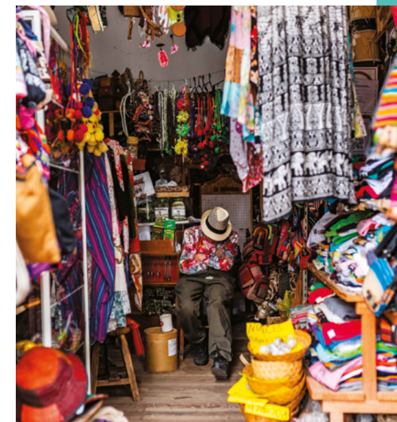
Work: Claudia Rolando

Students will also be involved in internships, workshops, advanced training courses and talks.