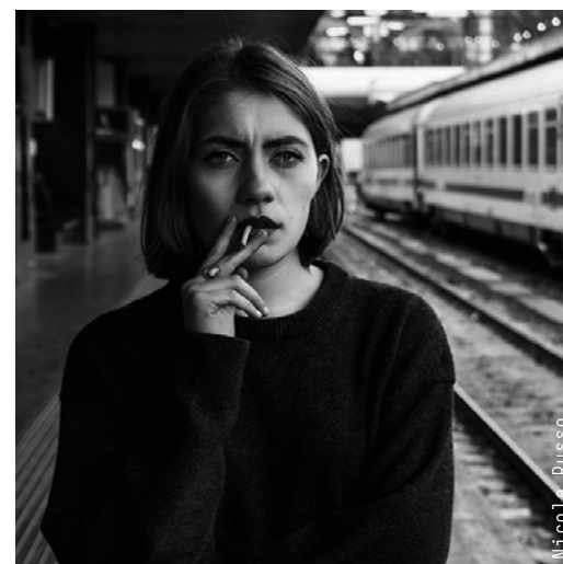
Work: Niccolò Russo

through the moment, be it the glamorous one of a magazine, the dramatic one of a newspaper, the conceptual one exhibited in a museum, or the intangible one that streams on a touch screen. Studying Photography and Audiovisual through our Bachelor of Arts means all of this. But first of all it means possessing the necessary technical knowledge to work with this medium: learning the basic photography techniques, but also editing and film shooting techniques, lighting systems and cinematography, as well as digital image processing.