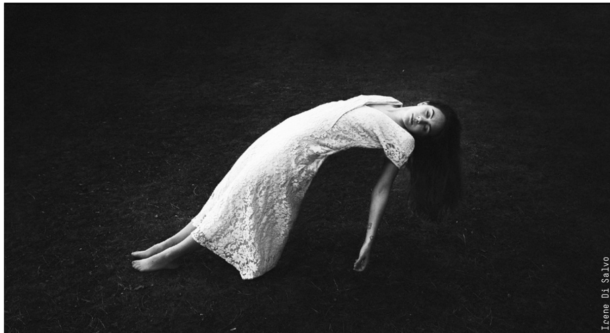
Work: Irene Di Salvo