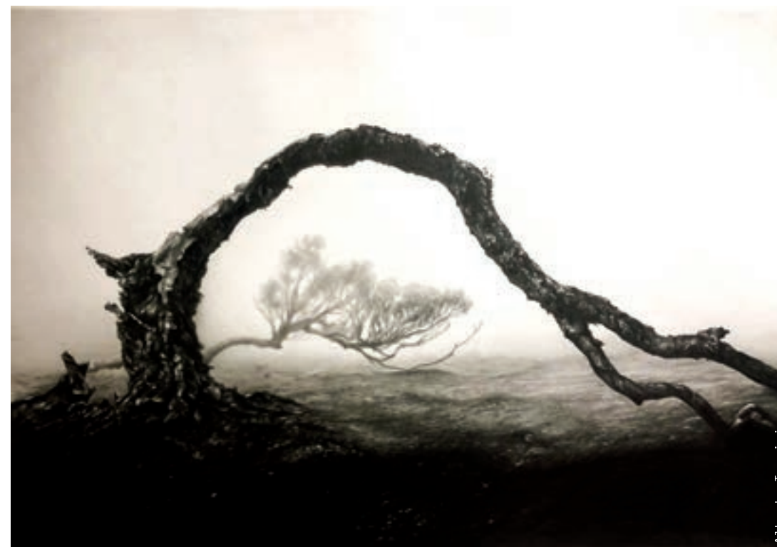
Work: Alberto Torzini

delle immagini è il linguaggio universale dell'umanità. Studiare Pittura e arti visive nel nostro triennio significa tutto questo. Ma prima ancora significa impossessarsi degli strumenti tecnici indispensabili per lavorare con le immagini: imparare i fondamenti del disegno e le diverse tecniche e tecnologie delle arti visive, e allo stesso tempo conoscere in maniera approfondita i linguaggi espressivi più nuovi come la fotografia, il video e i linguaggi performativi e multimediali. Ma l'artista deve avere anche una approfondita conoscenza della storia dell'arte come storia delle immagini, dell'estetica come pensiero sulle immagini e del sistema dell'arte come circolazione delle immagini. Deve conoscere i musei, le gallerie, i critici e gli altri artisti che con lui e prima di lui hanno percorso la stessa strada. E deve saper organizzare, curare e presentare il suo lavoro, oltre a saper parlare e scrivere in inglese. Per questo nel nostro triennio una serie di materie storiche e teoriche fondamentali completano la formazione, insieme a un nutrito calendario di appuntamenti con i protagonisti del mondo dell'arte contemporanea: tirocini, workshop, corsi di alta formazione, studio visit e talk, completano il percorso di formazione durante il triennio.