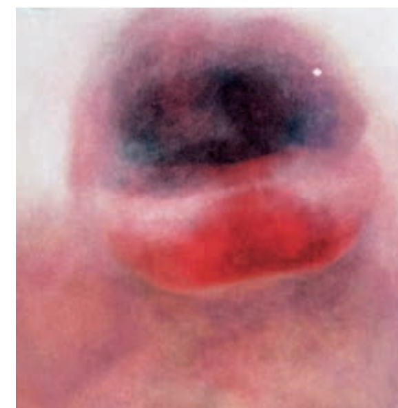
Work: Birce Demetoglu

Studying Painting and Visual Arts through our Bachelor of Arts means all of this. But first of all it means possessing the necessary technical knowledge to work with images: learning the basics of drawing, techniques and technologies of visual arts, mastering the newest forms of expression such as photography, video, performing and multimedia arts. Artists must have an in-depth knowledge of history of art intended as history of images, aesthetics intended as reflecting upon images and the art system intended as artwork circulation. They must have a deep understanding of museums, galleries, critics and other artists who have followed the same path as them and before them. They must know how to organize, take care of and present their work, as well as how to speak and write in English. A variety of essential history and critical thinking subjects complete the education provided by our Bachelor of Arts, in addition to many events with contemporary art key players. Students will also be involved in internships, workshops, advanced training courses and talks.